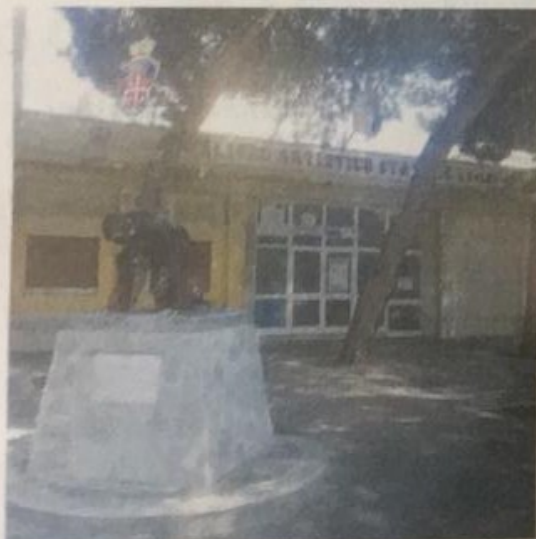
Colao L'edificio necessita di interventi di manutenzione

Nei due istituti scolastici diretti da Raffaele Suppa oltre settecento studenti frequentano i diversi indirizzi di studio